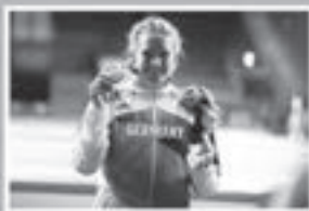
Projektpatin Aline Rotter-Focken Olympiasiegerin 2020 Tokyo im Ringen

Tourist-Information #Echt Unterkirnach Mühlenplatz 8 78089 Unterkirnach