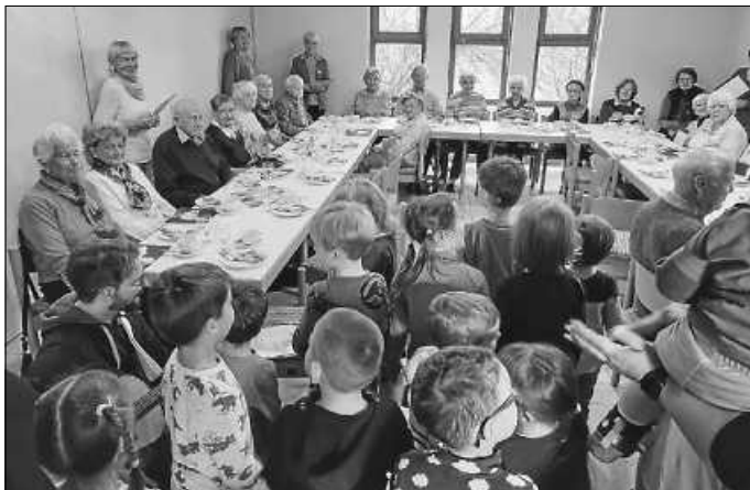
Die Kindergartenkinder bereiten mit ihren Liedern eine große Freude