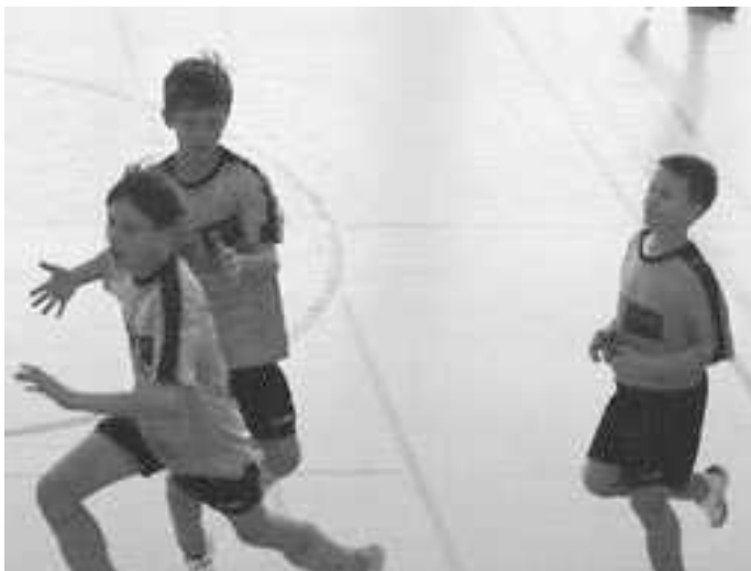
HBM in Hinterzarten