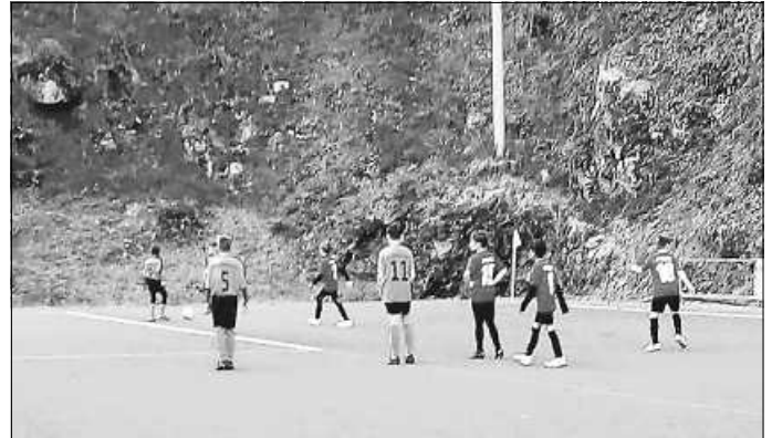
E Jgd gegen FC Triberg