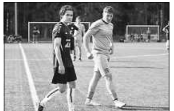
A Jgd gegen FC Kappel