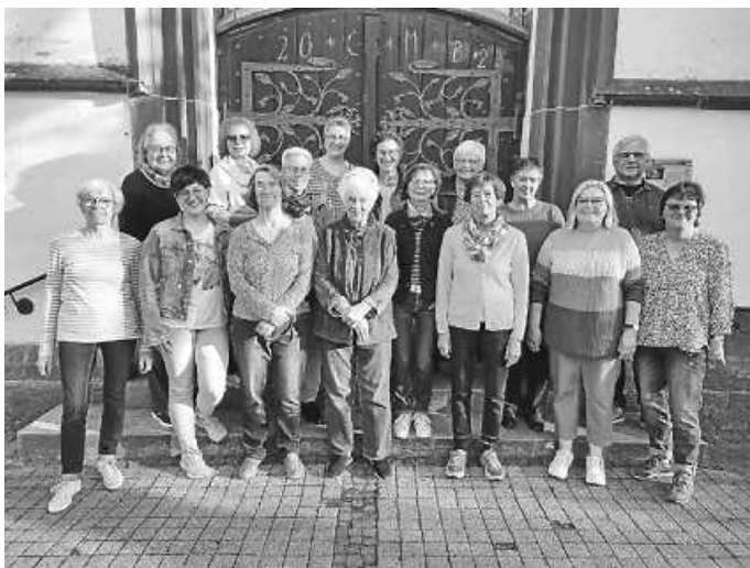
Von der Agrarwissenschaftlerin über die Bankkauffrau bis zur Rentnerin hat sich eine interessierte und motivierte Kursgruppe zusammengefunden.