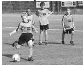
E-Jgd beim FC Peterzell