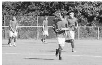
A-Jgd gegen FC 08 Vill. 2

Musikverein Unterkirnach e.V. www.musik-unterkirschach.de