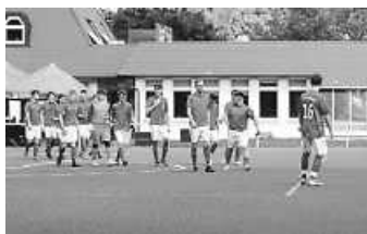
A-Jgd gegen FC 08 Vill. 2