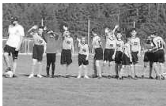
E-Jgd beim FC Peterzell

MI, 14.06. B-Jgd SG Königsfeld - SG Peterzell 19:00 Uhr SA, 17.06. D-Jgd SG Vöhrenb./Unterkirnach - FC Furtwangen 13:00 Uhr SA, 17.06. C-Jgd SG DJK Donauesch. - SG St. Georgen 15:00 Uhr SA, 17.06. A-Jgd SG Rietheim - SG Unterkirnach 17:00 Uhr Wir wünschen den Mannschaften viel Erfolg !!