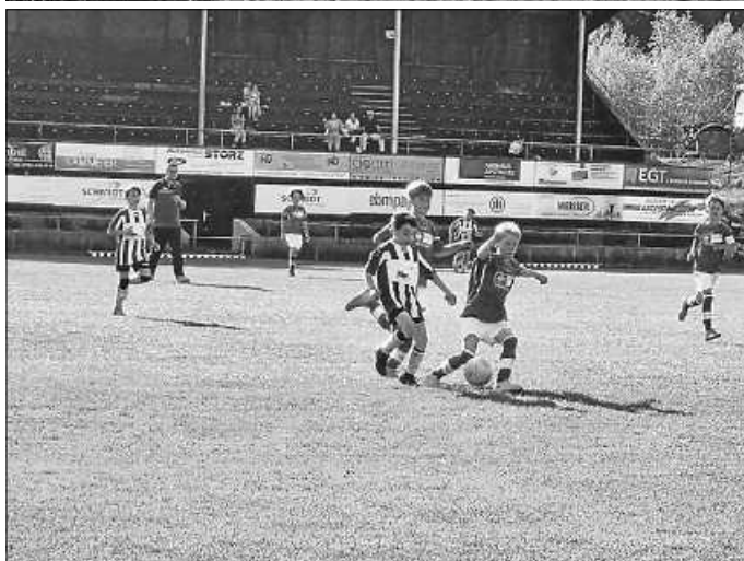
E-Jgd in St.Georgen