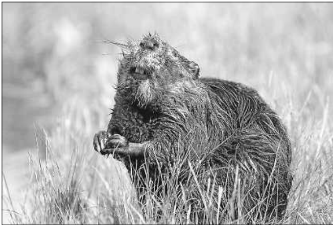
Der Biber ist nach Baden-Württemberg zurückgekehrt – und sorgt mancherorts für Konflikte.

Um anschließend als ehrenamtlicher Biberberater tätig werden zu können, ist eine Bestellung durch die zuständige untere Naturschutzbehörde im jeweiligen Landkreis notwendig. Für die Anmeldung sowie für weitere Informationen können Interessierte bis spätestens 15. November das RP kontaktieren: bibermanagement@rpf.bwl.de. Für eine telefonische Auskunft stehen Tobias Kock (0761/208-4223) und Janina Heck (0761/208-4156) zur Verfügung.