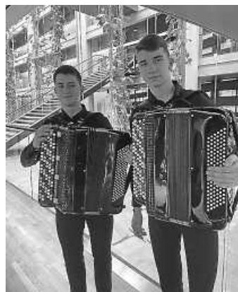
Unsere Gäste: Die Pankiv Brothers

Der Eintritt ist frei - wir freuen uns über eine Spende. Es wird bewirtet.