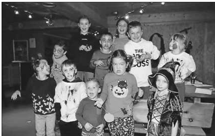
Die gruselige Gesellschaft hatte großen Spaß!